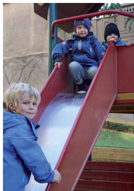
○ Op de Zweedse pre-school wordt elke dag buiten gespeeld, ook in de winter

Toen Zweden eind jaren tachtig meer vrouwen nodig had op de arbeidsmarkt, kwamen de feministen volgens Wittenmark met de oplossing. Vrouwen moesten gelijke kansen krijgen; ook op de arbeidsmarkt. De overheid speelde hier gretig op in met onder andere een aantrekkelijke verlofregeling. In totaal bestaat het ouderschapsverlof voor beide ouders uit 480 dagen. Zestig dagen zijn gereserveerd voor elke ouder om ook papa's te stimuleren om thuis te blijven met de kinderen. Tachtig procent van het salaris wordt tijdens het verlof doorbetaald. Mannen nemen over het algemeen vijftien procent op van het totaal aan verlofdagen, waaruit blijkt dat de gelijke verdeling in de praktijk toch nog ver te zoeken is. Echter, wanneer je de