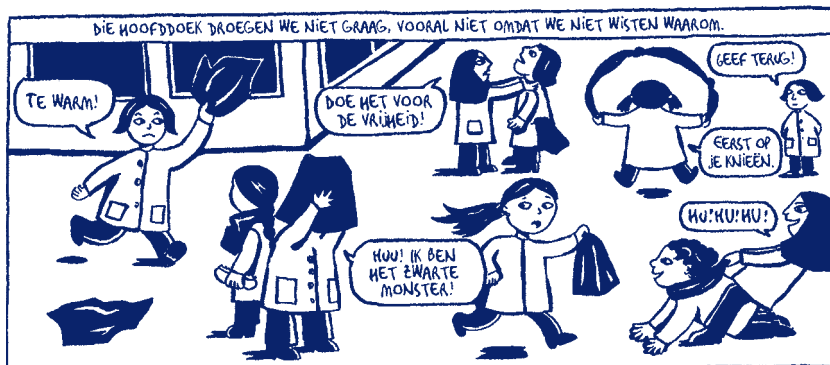
Illustratie uit Persepolis 1.

Fatima Mernissi , De Europese harem . Breda (De Geus) 2001.