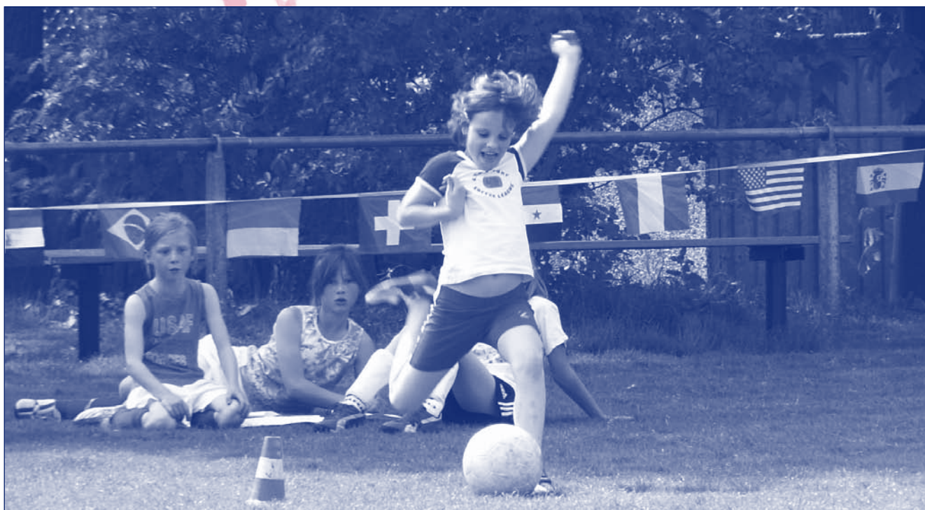
EK Voetbalkaravaan 2007, meisjesclinics.

“Cursussen om trainer te worden zijn ontzettend duur. Bij mannen wordt