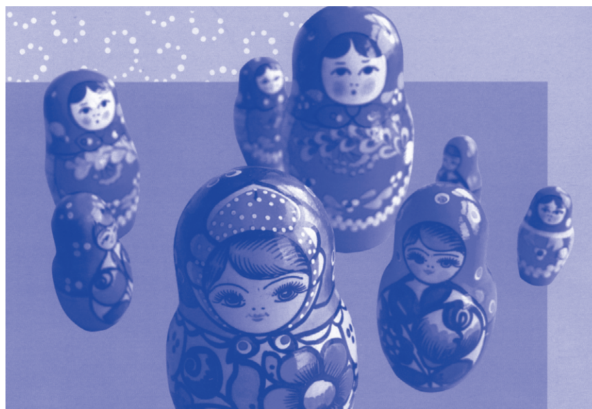
Folder Eigen Kracht Centrale.

Even wat cijfers. Uiteindelijk houdt gemiddeld 75 procent van de aangeelde gezinnen een formele conferentie. Ongeveer 13 procent bedenkt zonder formele bijeenkomst (zonder coördinator) een plan en bij ongeveer 12 procent lukt het niet. Dan is er teveel ruzie en in een enkel geval is er geen familie beschikbaar. Het gemid-