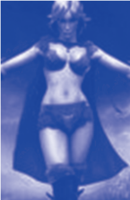
Beeld uit een computergame.

Dit blijkt uit een grootschalig onderzoek van Rutgers Nisso Groep onder 10.905 jongeren vanaf 12 jaar. Het blijft echter niet bij het stellen van vragen: een op de vier jongens en een op de vijf meisjes die actief worden op internet hebben binnen een half jaar online seks. Meer dan de helft van deze jongeren kijkt naar beelden van blote lichamen of seksueel gedrag van iemand anders. Tevens kleden zij zich uit voor de webcam en verrichten daarbij seksuele handelingen zoals masturberen.